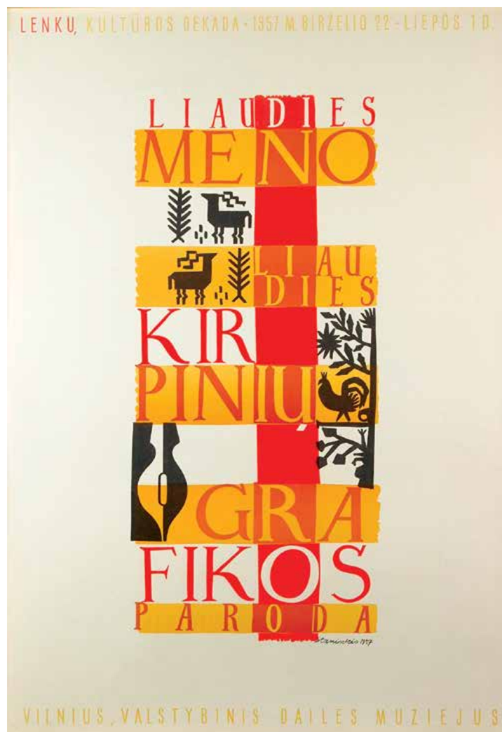
△ Plakat do wystawy Dekada polsko-litewska w Państwowym Muzeum Sztuki, w Wilnie, 1957 rok