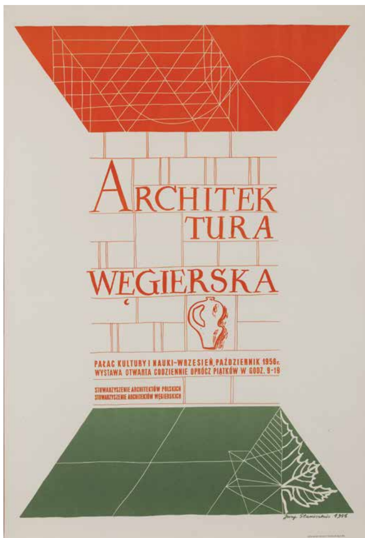
△ Plakat do wystawy Architektura Węgierska w Pałacu Kultury i Nauki w Warszawie, 1956 rok