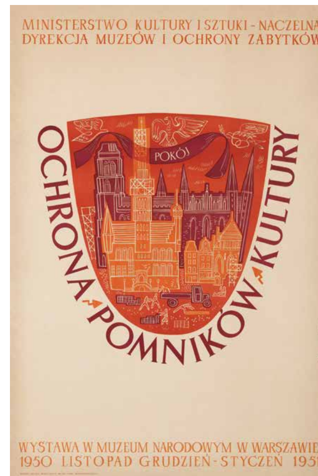
△ Plakat do wystawy Ochrona pomników kultury , 1950 rok